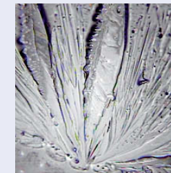
Nach 4-wöchiger Anwendung